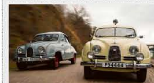
VETERANER. Två Saab 93 från 1957.

I november i fjol bytte 51 862 hushåll elhandelsbolag, enligt Statistiska centralbyrån (SCB). Det är 18 procent fler än i november året före. (TT)