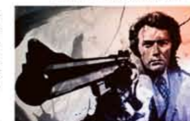
PANG! Dirty Harry på kontoret.