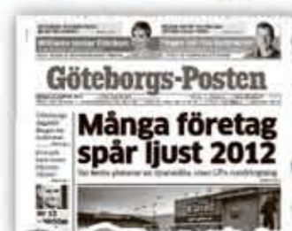
GP I GÅR.

NÄRINGS- LIV: Bankerna blir allt tuffare i sina krav på företagen. Utlåningen har minskat rejält sedan i somras. Men inte i Västsverige.